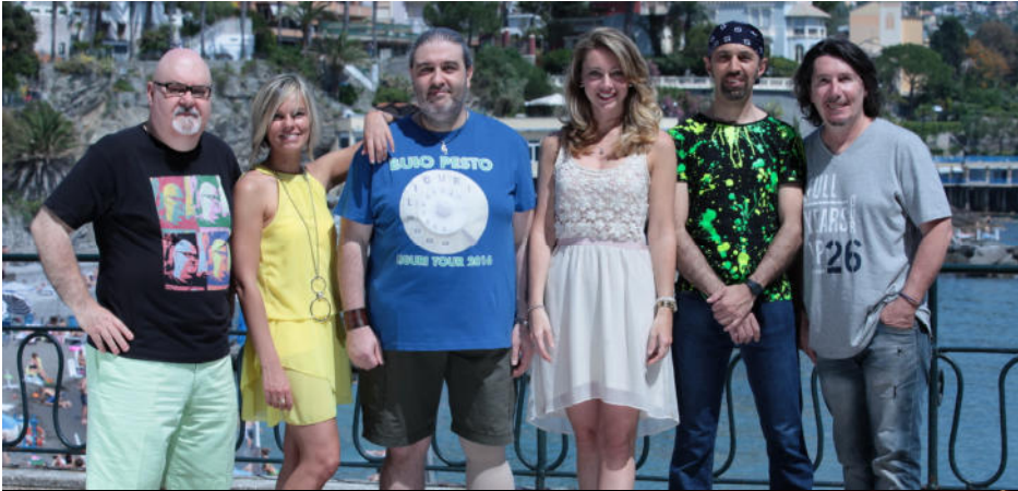
GENOVA – Piazza De Ferrari - 10 Settembre 2011

I Buio Pesto sono la più grande e divertente band dialettale ligure degli ultimi 25 anni. Dal 1995 ad oggi hanno venduto 110.000 dischi (Doppio Disco di Platino), hanno eseguito quasi 1.000 concerti, per un pubblico di oltre 1.400.000 spettatori e raccogliendo 290.000 euro per beneficenza.